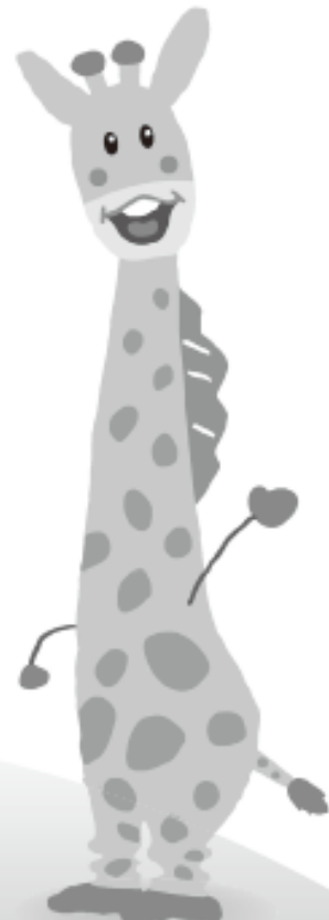
イメージキャラクター「あむりん」

教職員共済は、「つながり」と「信頼」を原点とする 生活協同組合として教職員の相互扶助の輪を広げます。 ご自身の「万一」のために、仲間の「万一」のために、 教職員どうしの助け合いの輪に参加しませんか!