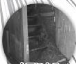
大雨による 床上浸水