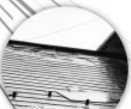
強風による 屋根の剥がれ