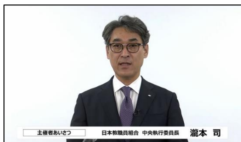
主催者あいさつ 日本教職員組合 中央執行委員長 瀧本 司

2022 年度日教組全国教研は、昨年度に引き続きオンラインで開催。24 の分科会に全国各地からの報告レポートをもとに 1 月 28・29 日両日で討議が行われました。