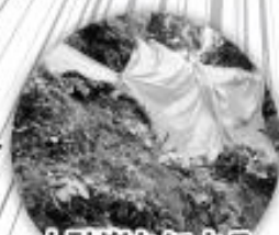
土砂崩れによる 家屋の破損