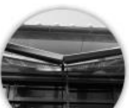
台風による 軒の破損

ぜひご検討ください! 自然災害共済を付帯すると、 「もしも」のとき こんなに違うんです!