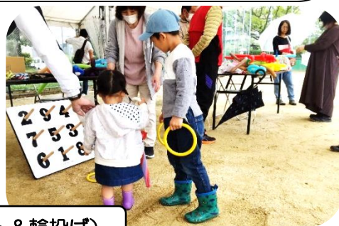
メーデー（バルーンアート&輪投げ）