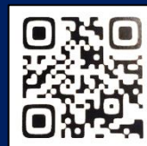
オンライン署名 QR コード

について議論されていますが、現場教職員の求める「7つの提言」に及んでいません。学校現場の「大ピンチ」を救うためにも、 この内容を中教審答申、今後の文科省の政策とするよう緊急署名に取り組んでいます。 ご協力をお願いします。