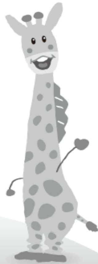
イメージキャラクター「あむりん」

教職員共済は、「つながり」と「信頼」を原点とする 生活協同組合として教職員の相互扶助の輪を広げます。 ご自身の「万一」のために、仲間の「万一」のために、 教職員どうしの助け合いの輪に参加しませんか!