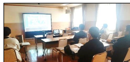
高知のサテライト会場の様子

まとめでは学校の働き方改革における「日教組三本柱（業務削減、定数改善、給特法廃止・抜本見直し）と7つの提言」はまちがいない。教職員が本来業務に専念できる環境整備を実現し子どもたちの豊かな教育が充実するために、ネット・紙面合わせ40万筆の署名をめざすことを確認し閉会しました。