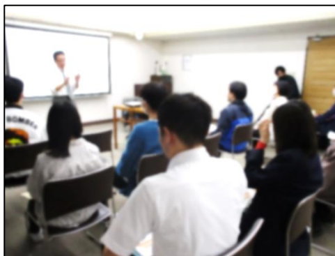
※昨年度の「ウェルカム講座」の様子